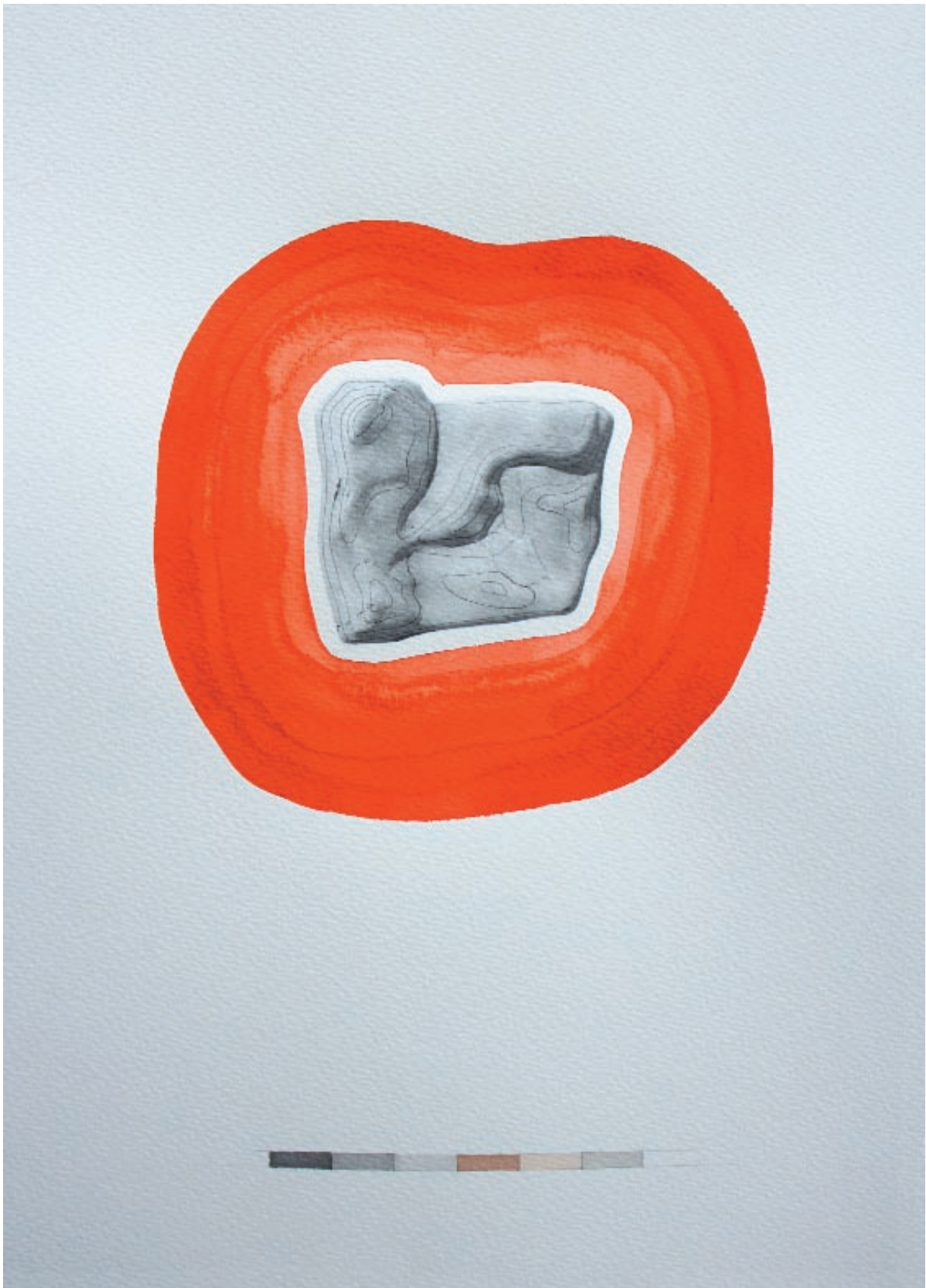
Sans titre 1 mixed media, photographie et dessin sur papier aquarelle 29,7/42cm 2012