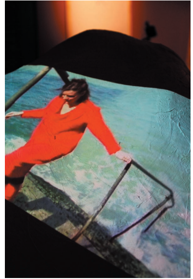
Installation, caisses en bois, moulages plâtre, pieds de micros, pico projecteurs, casques audio Bruxelles, 2011