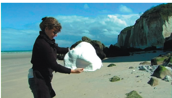
photogrammes, Vasterival, 2011