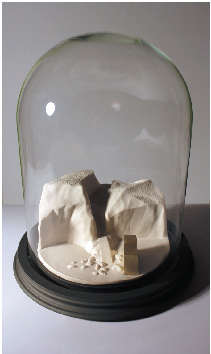
Light Cube on the beach Porcelaine, bois verre 22/30cm 2012