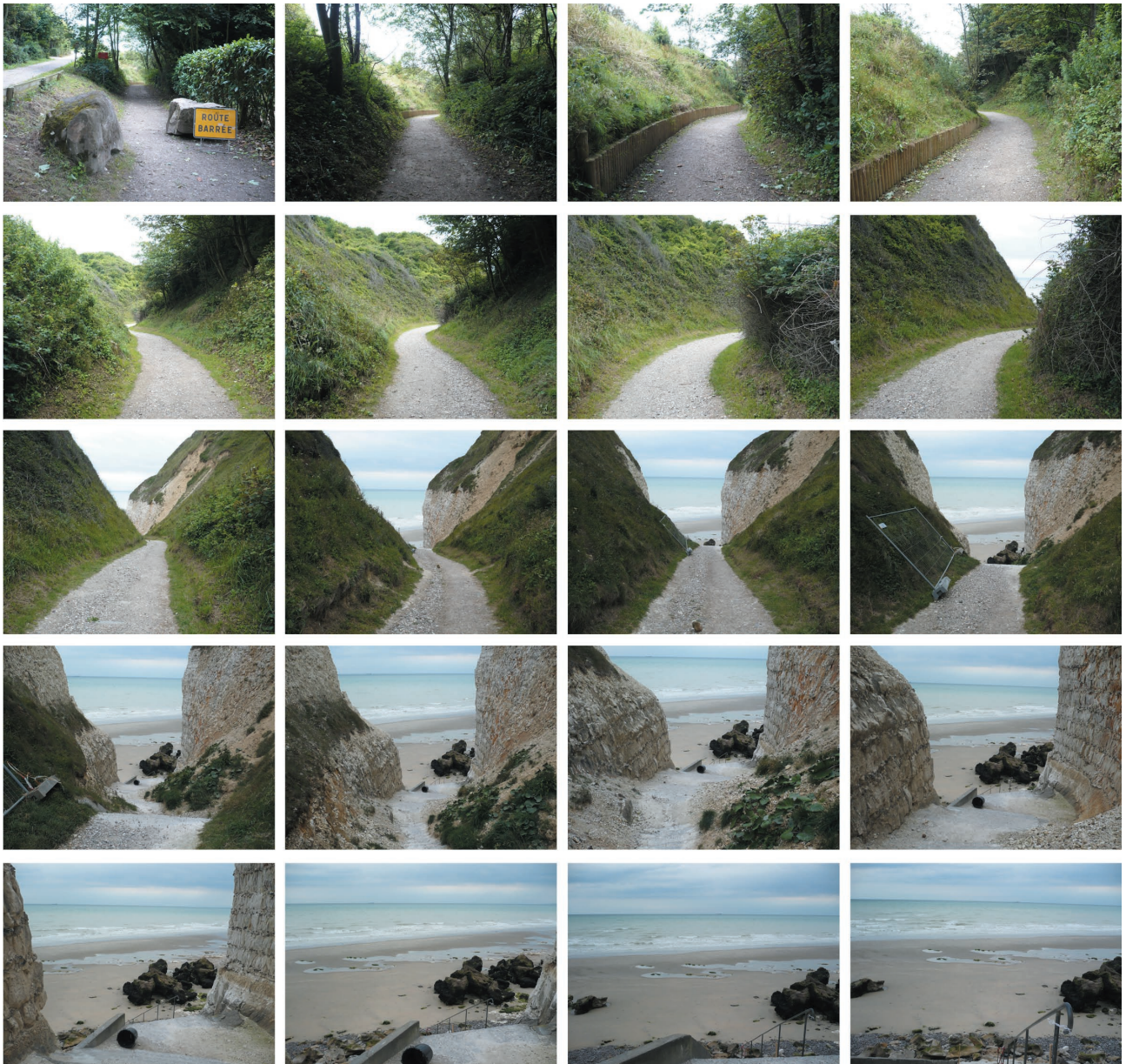
Descente dans la vauze Vaterival, Varengeville su Mer montage photographique, impression numérique sur Dibond, 68/65cm 2011